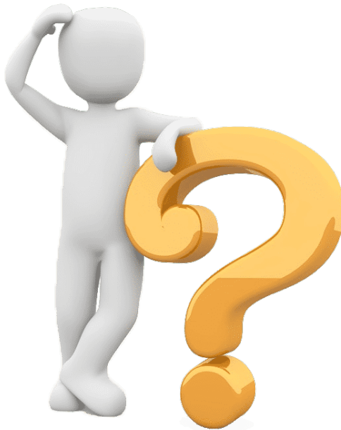
Figura 2 – Um exemplo de posicionamento de figura.

Para inserção de figuras, a legenda deve ficar acima, e fonte abaixo. Quando a fonte for o próprio autor, deve-se escrever "Fonte: acervo do autor". Para referencia a figura, use o ref, como "... Figura 2 .... ".