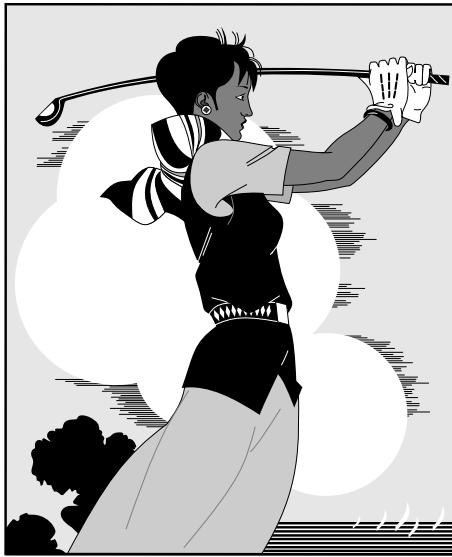
图 2-5 打高尔夫球的人 Fig.2-5 The person playing golf