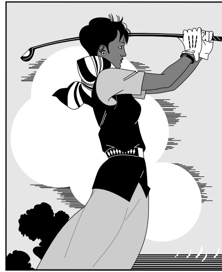
(b) 打高尔夫球的人 2 (b) The person playing golf