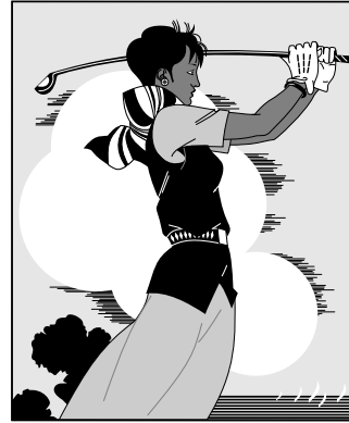
(b) 打高尔夫球的人 2 (b) The person playing golf