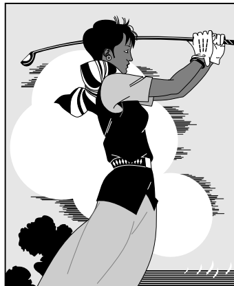
图 2-11 打高尔夫球球的人（博士论文双语题注） Fig. 2-11 The person playing golf (Doctoral thesis)

Fig. 2-10 The person playing golf. Please note that, although it is appropriate to put subfigures' captions under this caption as stipulated in regulation, but its format is not clearly stated.