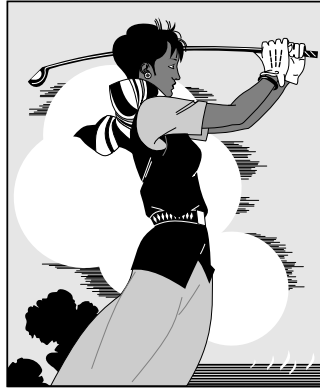
(a) 打高尔夫球的人 1 (a) The person playing golf