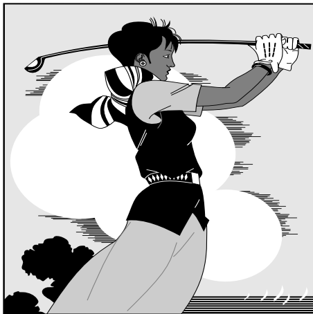
图 2-7 打高尔夫球的人。注意，此图对齐方式是图片底部对齐 Fig.2-7 The person playing golf. Please note that, it is vertically bottom aligned for figure.