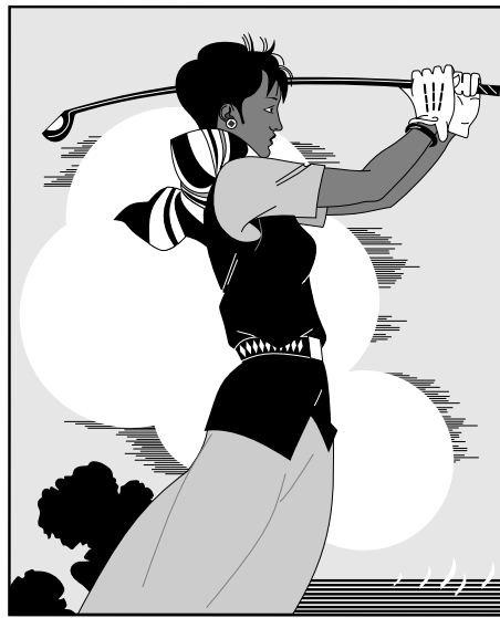
图 A-1 打高尔夫球的人