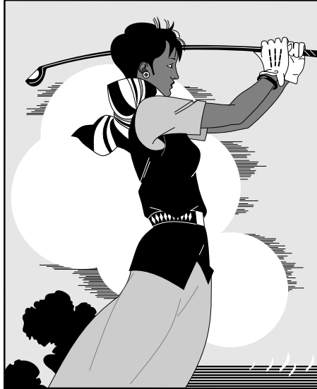
图 2-4 打高尔夫球的人。注意，这里默认居中 Fig.2-4 The person playing golf. Please note that, it is vertically center aligned by default.