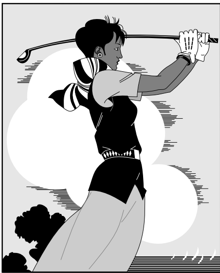
(c) 打高尔夫球的人 3 (c) The person playing golf